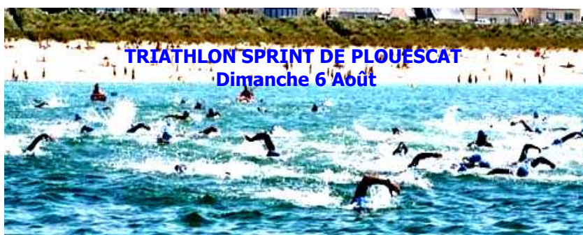
TRIATHLON SPRINT DE PLOUESCAT Dimanche 6 Août

DATE LIMITE DES RÉSERVATIONS POUR LE REPAS DU MERCREDI : 28 JUILLET